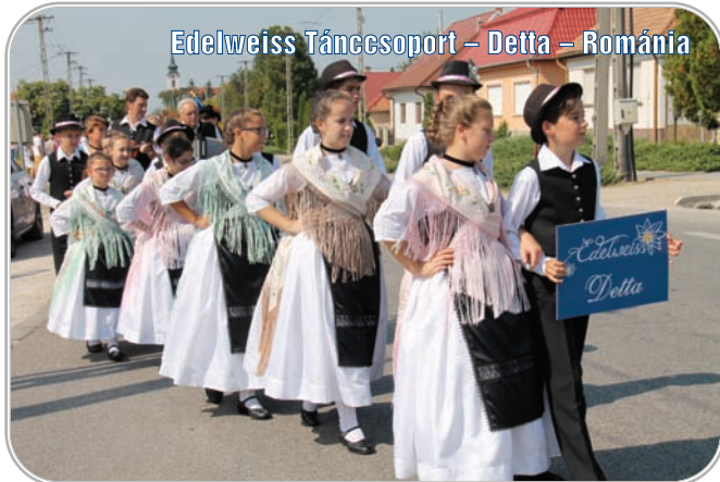
Edelweiss Táncsoport – Delta – Románia