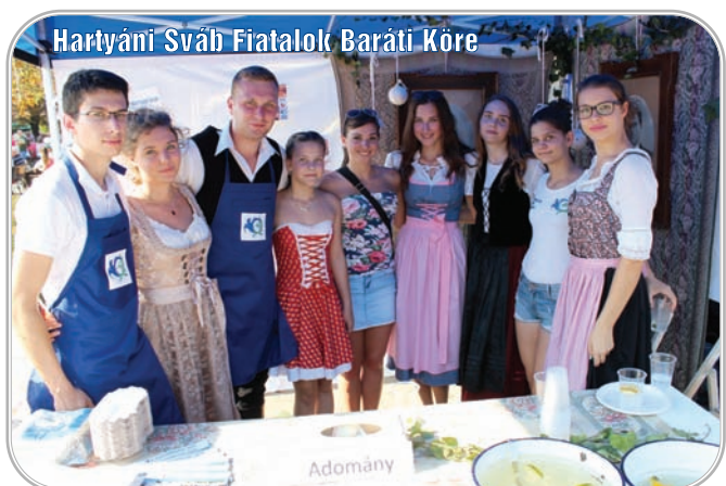
Hartyáni Sváb Fiatalok Baráti Köre