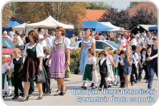
Újhartyáni Német Nemzetiségi Gyermekvár Óvoda csoportja