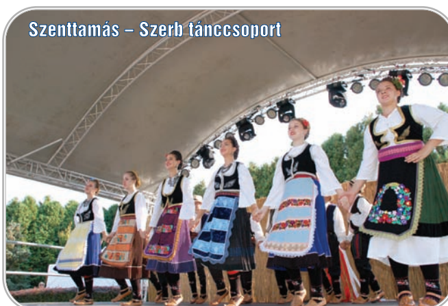
Szenttamás – Szerb táncsoport