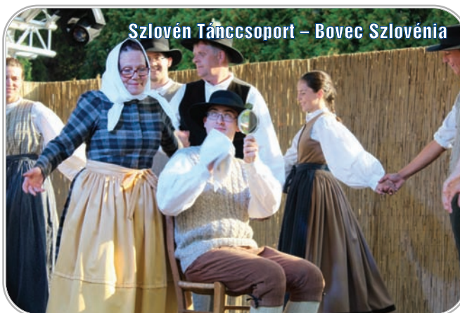
Szlovén Táncsoport – Bovec Szlovénia