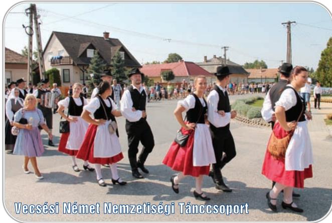
Vecsesi Német Nemzetiségi Táncsoport