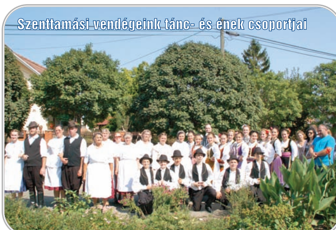
Szenttamási vendégeink tánc- és ének csoportjai