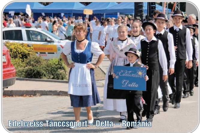
Edelweiss Táncsoport – Delta – Románia