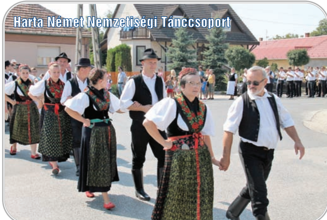
Harta Német Nemzetiségi Táncsoport