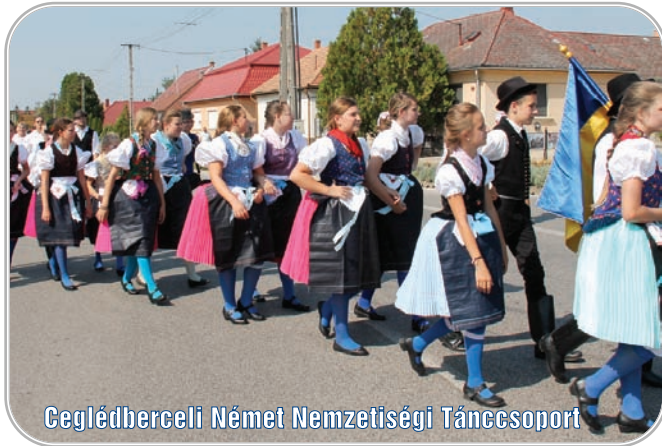
Ceglédberceli Német Nemzetiségi Táncsoport