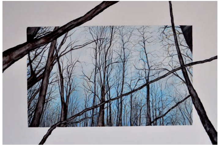
Hornyák Evelin: Szabálytalan rengeteg, 2017, akril/vászon, 70x100cm