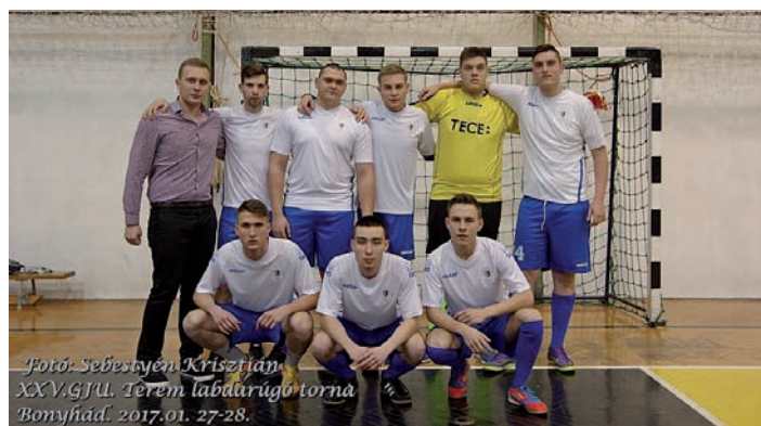
XXV. GJU. Terem labdarúgó torna Bonyhád, 2017.01. 27-28.