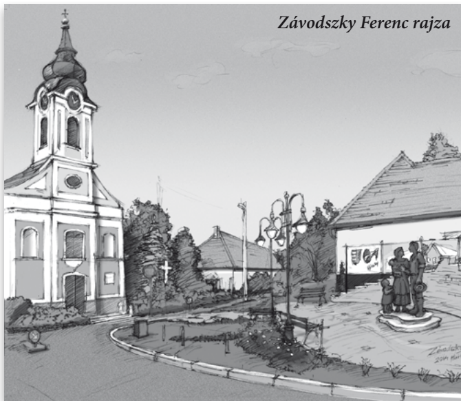
Závodszky Ferenc rajza