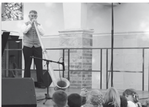
1. Tapfheim polgármestere a Hartyánfesztén /2013/