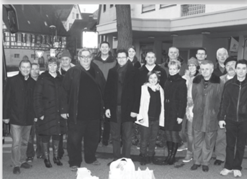
2. Freibergi barátaink és a hartyáni csapat /2014/