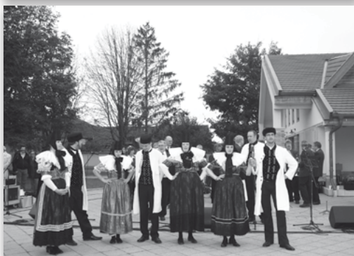
3. Bad Nenndorfi táncosok a Hartyánfesztén /2010/