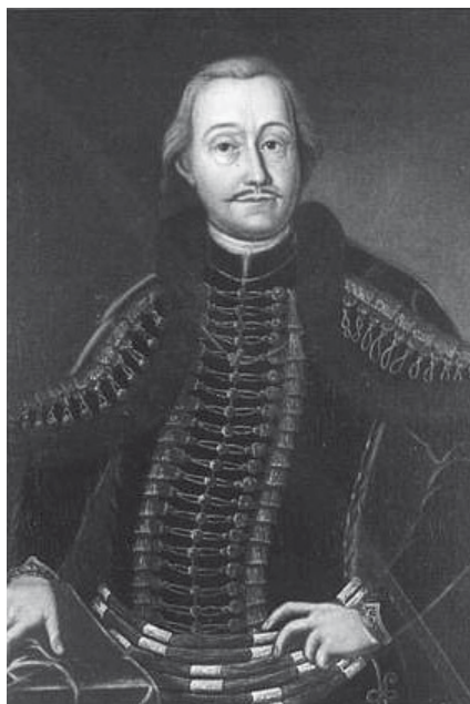
gróf Grassalkovich Antal

Február 20-án nagy eseményt ünnepelhettünk Városcsopont pinceklubjában, ugyanis ezen a napon nyitottuk meg hivatalosan a 2014-es Grassalkovich évet. 250 éve ezen a napon jelent meg Grassalkovich Antalnak „a nagy telepítőnek” a hartyáni puszták betelepítéséről szóló hirdetménye, amely mindannyiunk életére kihatással van. Most szeretnénk egy kis ízelítőt nyújtani előadásunkból, hogy minél többen megismerjék Újhartyán betelepítésének történetét.