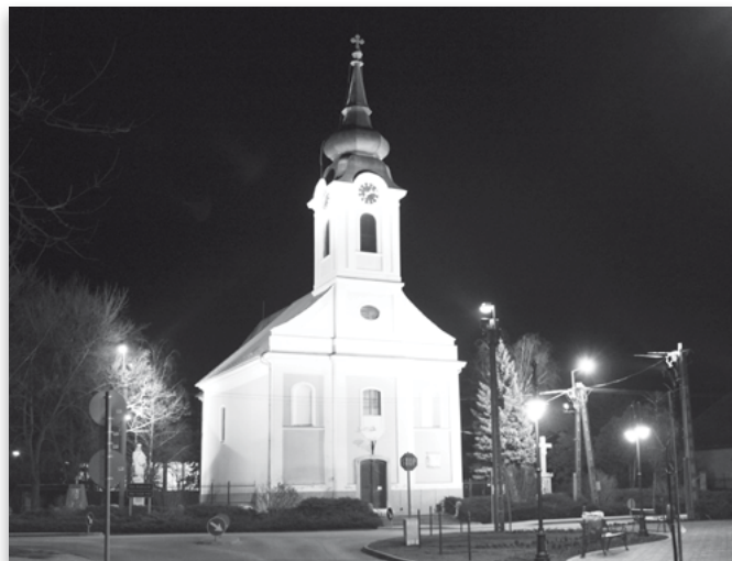
(Római Katolikus templomunk a 2014-es jubileumi évünkben díszkivilágítást kapott )

A három szent nap Jézus szenvedését, halálát, és feltámasztását idézi emlékeztetünkbe. Nagycsütörtök: az Oltáriszentség alapításának ünnepe. Nagypéntek: Jézus kereszthalálával nyilvánítja megváltó szeretetét. Nagyszombat: az égő gyertya jelképezi a halhatatlan Jézust. Ilyenkor újítjuk meg keresztségi fogadalmunkat. Húsvétvasárnap: ez a nap Urunk feltámasztásának dicsőséges ünnepe. Jézus megdicsőült testtel kilépett sírjából. Többé a halál nem uralkodik rajta. Nekünk is megígérte: Aki bennem hisz, ha meghal is, élni fog.