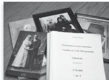
„A vastag anyakönyvi adattár”

„Mert a boldogsághoz kevés csak a jelen, A múlton épül az, s az emlékezeten.”