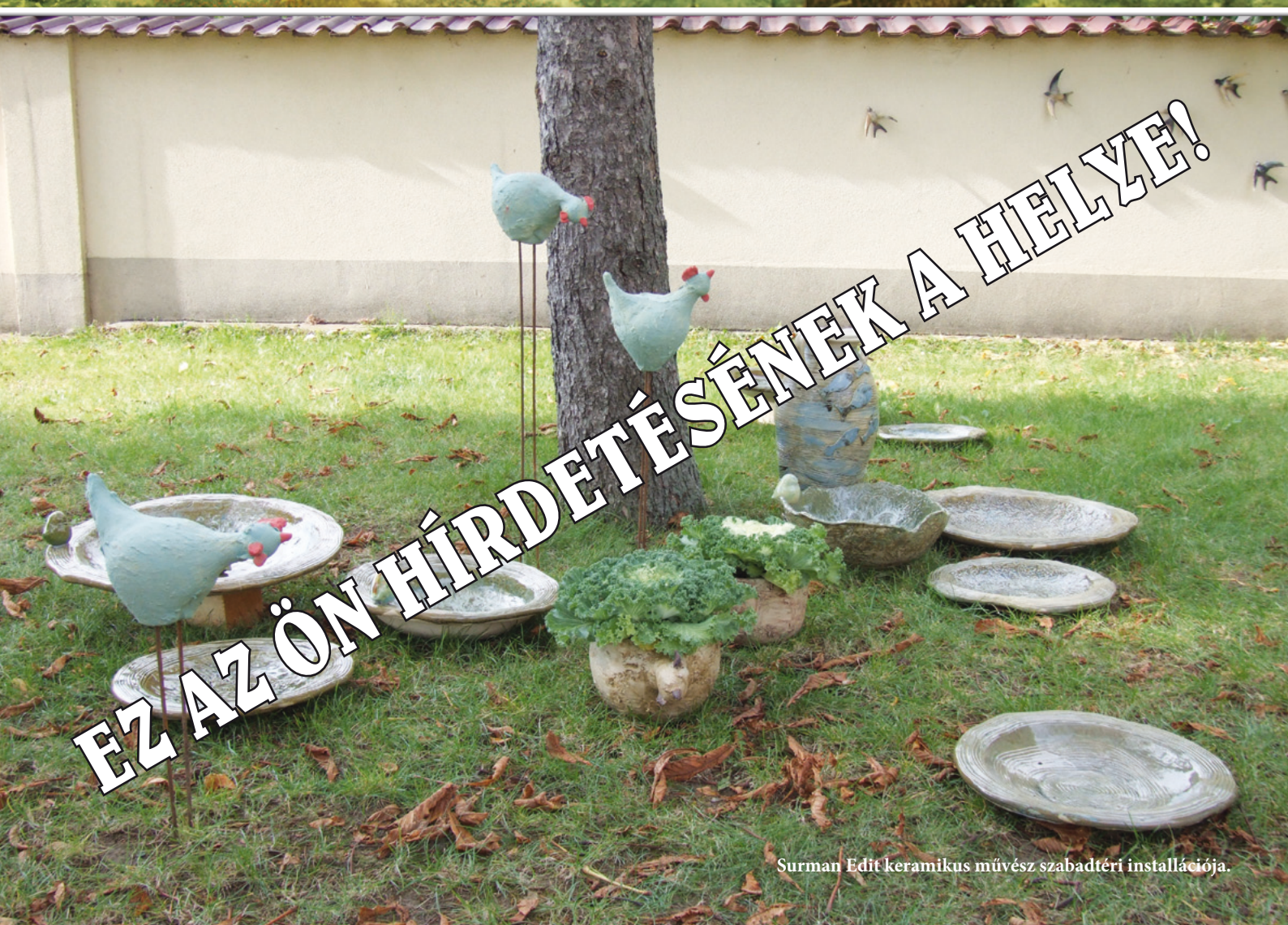
Surman Edit keramikus művész szabadtéri installációja.