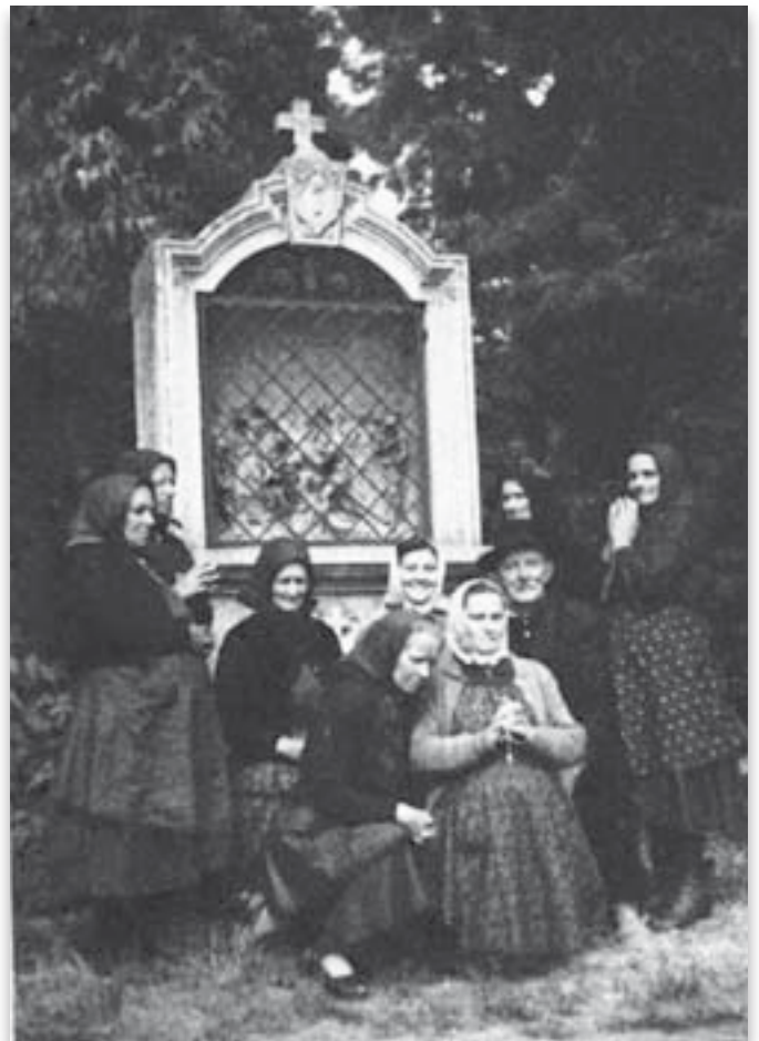
Újhartyáni zarándokok Az 1960-as években Máriabesnyőn.