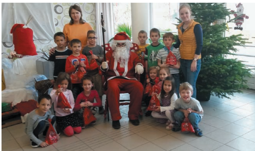
Mikulás a Gyermekvár óvoda „Bagoly” csoportjával 2015. dec. 4.

cember 7-én az alsós munkaközösség szervezésében megérkezik a Mikulás. A nagyobbak legalább olyan izgalommal várják, mint a kisebbek. Iskolánkban minden évben Luca-napi színes programokra invitálják alsós diákjainkat tanítóik. Ezen a napon „lucabúzá” ültetnek a gyerekek, elvetik saját búzaszemeiket egy kis pohárba, s izgatottan várják, vajon kibújnak-e karácsonyig a zöld levelek? Bízom benne, hogy változatos programjaink rámutatnak az adventi időszak lényegére, ráhangolnak bennünket a Karácsony megünneplésére.