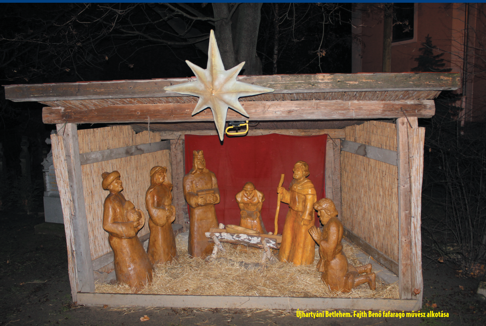
Újhartyáni Betlehem. Fajth Benő fafaragó művész alkotása