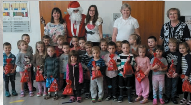
A Mikulás idén is meglátogatta a „Gyermekvár” óvodásait.

A Tulipán csoport is énekkel és verssel köszöntötte.