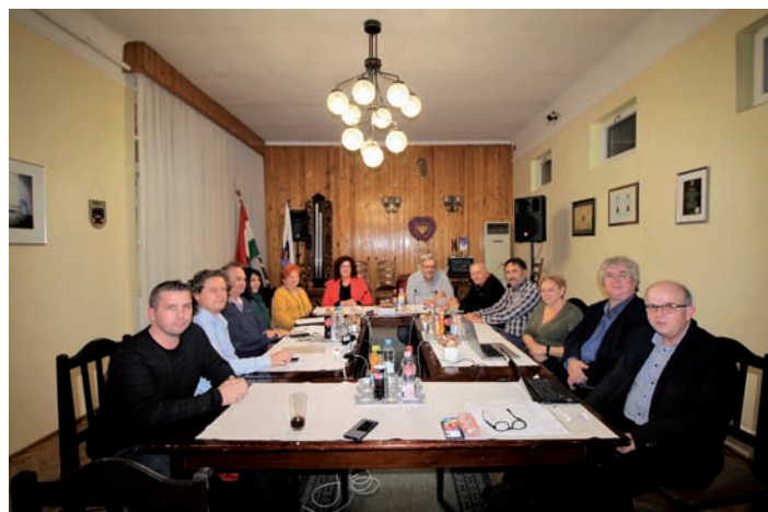
Az új testület és a bizottsági tagok üléseznek.