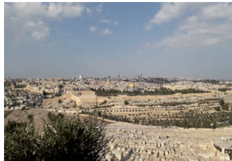
3. A velünk utazó házaspárok újraesketése a kánai menyegző helyszínén