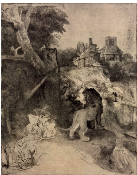
Rembrandt: Az olvasó Szent Jeromos itáliai tájban, 1653, rézkarc

szerintem zsenialitása kiemelte ebből a körből, nem a korszakára jellemző, hanem évszázadokkal későbbi stílusjegyeket is mutatnak munkái. Időskori önarcképein is úgy látom, hogy szinte már a 19. századi, a világot a képzőművészetben akkor is megrengető jegyeket láthatunk alkotásain, szemben a barokk inkább a részletekre figyelő összpontosításával, ő a lendületből merített harmóniával old meg felületeket. Ezzel a teremtett rendet tudja megmutatni az így festett alakzatban, nem csak „lefényképezi” a valóságot, hanem a formák