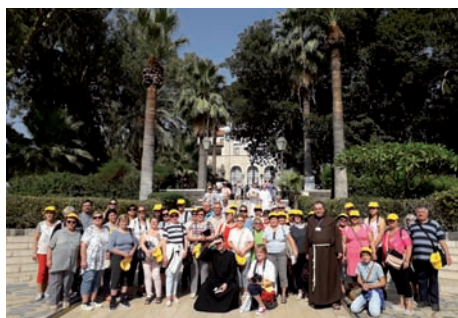
6. Jeruzsálemi látkép