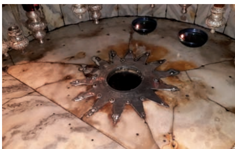
A júdeai Betlehemben, a kis Jézus születésének pontos helyén