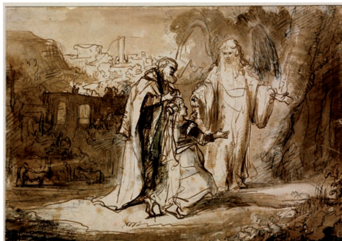
Ferdinand Bol (Rembrandt tanítványa): Az angyal megjelenik Manoahnak és feleségének, tollrajz