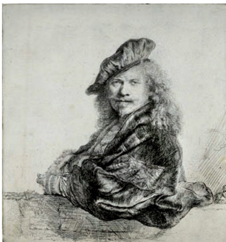
Rembrandt: Önarckép, 1639. rézkarc

Rembrandt halálának 350. évfordulója alkalmából nyíló kiállítás látható a Szépművészeti Múzeumban. Rembrandt a világ egyik legismertebb festője, pedig annak a kornak szülöttje, amelyik nem a festészetben, hanem a zene területén ontotta a zseniket szinte halmozva, Bach, Vivaldi, Händel, Pergolesi, Scarlatti neve valószínű ismerős mindenkinek. Ez a barokk kor (XVII. sz., XVIII. sz. első fele), ami az őt megelőző (XV. sz., XVI. sz.) reneszánszot követte, ahol viszont