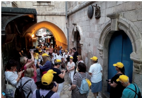
2. Csoportkép a Nyolc Boldogság hegyén