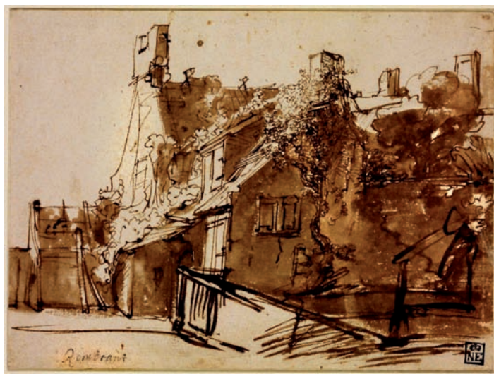
Rembrandt: Holland ház napfényben, 1635–1636 között, tollrajz, barna tinta, papír