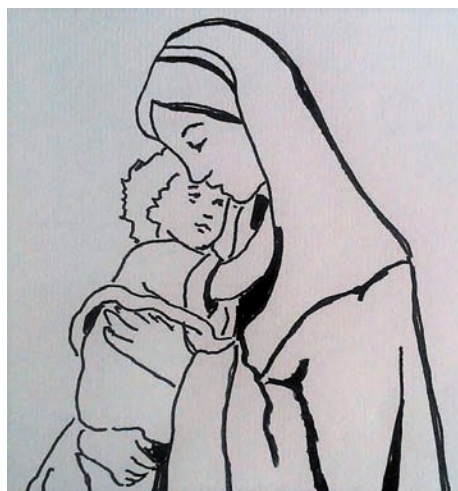
(Illusztráció: Agárdi Gabi)

Hálás köszönet mindenkinek, aki ezek létrejöttéhez hozzájárult: