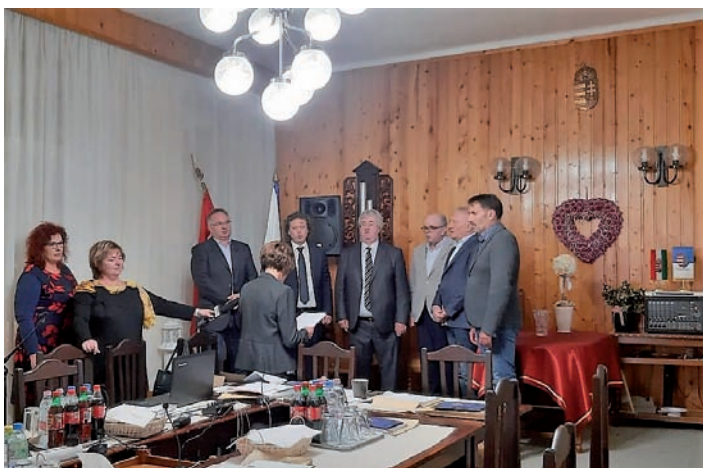
Az új testület eskütétele.

– az önkormányzat úgy döntött, hogy pályázatot nyújt be