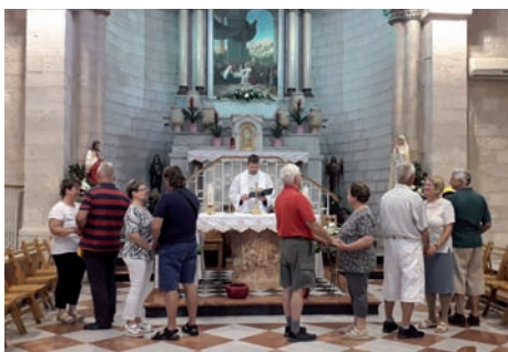
5. „Via Dolorosa” - Jézus igazi keresztútján...