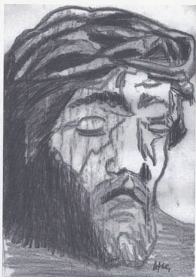
Jézus fej fafaragványról mintázva 2 · grafika papír · 30x42 cm