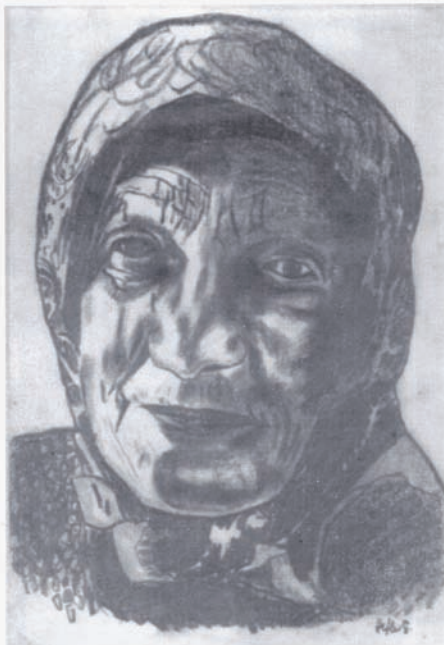
Édesanyám arcképe · grafika papír · 37,5x51 cm

- Évi 80-100 festmény? Ez azért elég szép szám, és persze rengeteg energia!