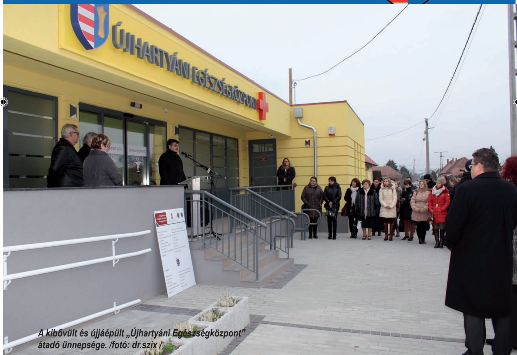
A kibővült és újjáépült „Újhartyáni Egészségközpont” átadó ünnepsége.

Békés, Áldott Karácsonyt és Boldog Új Esztendőt kívánunk minden kedves olvasónknak!