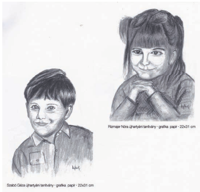
Szabó Géza újhartyáni tanítvány · grafika papír · 22x31 cm