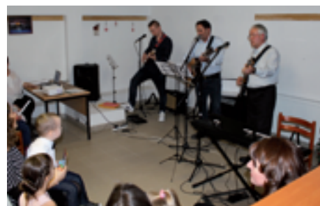
Irodalmi est a Könyvtár pinceklubjában