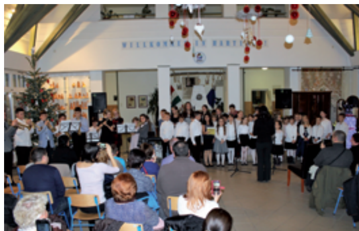
Zeneiskolások félévi koncertje