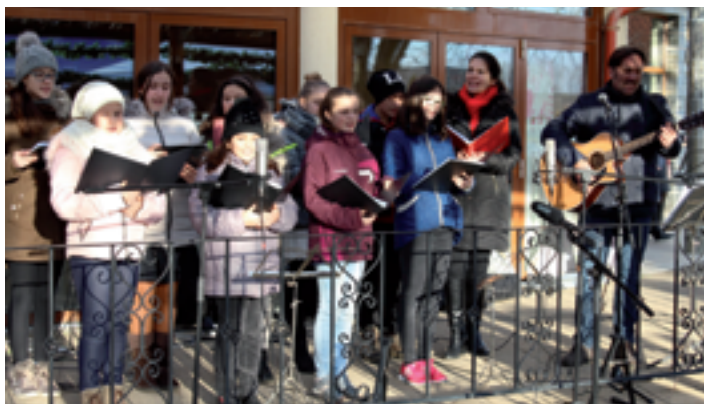
Adventi vásár és ének a Hősök terén