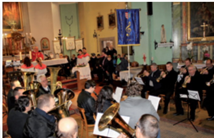
Zászlószentelő német-magyar szentmise