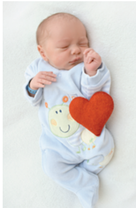
Schulcz Frigyes Ragnar