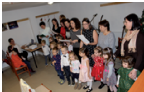
Karácsonyi irodalmi est a Pinceklubban