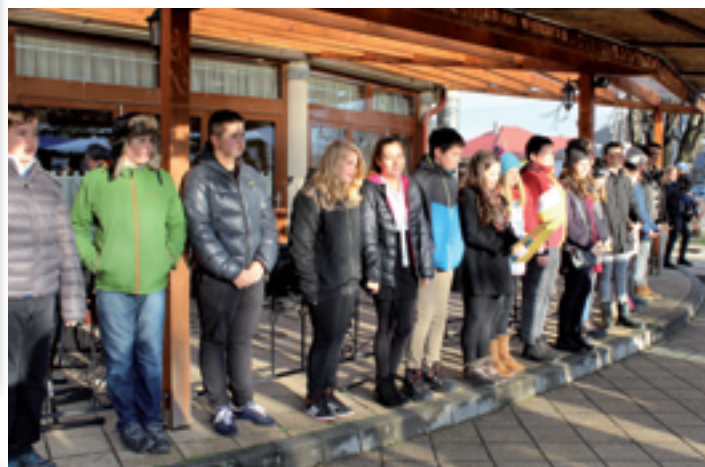
Iskolások karácsonyi kórusa