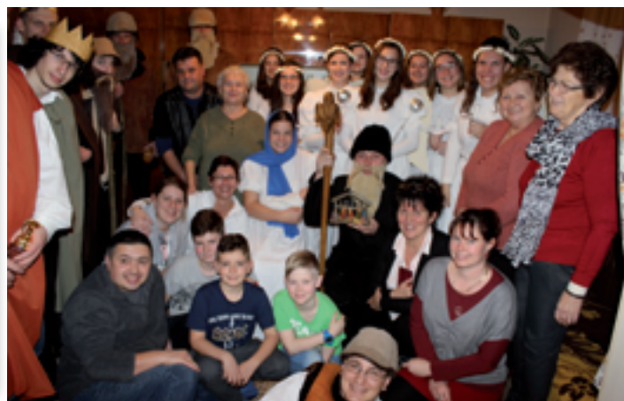
Sváb fiatalok baráti köre a családoknál betlehemezett