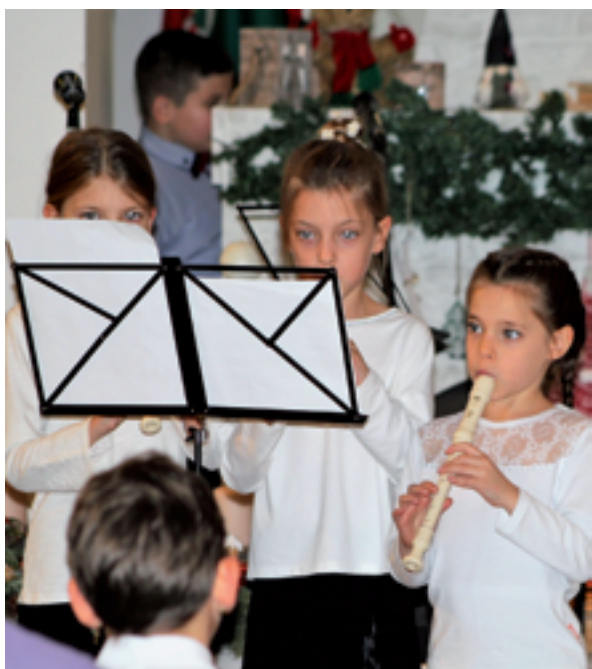
Zeneiskolások adventi koncertje