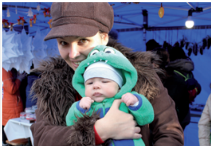
Adventi vásár legfiatalabb látogatója