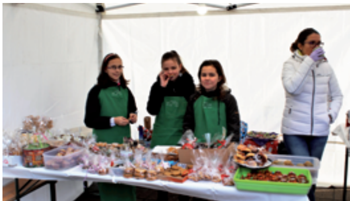
Adventi vásár a Hősök terén