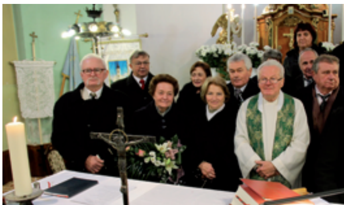
Házassági évfordulások szentmiséje