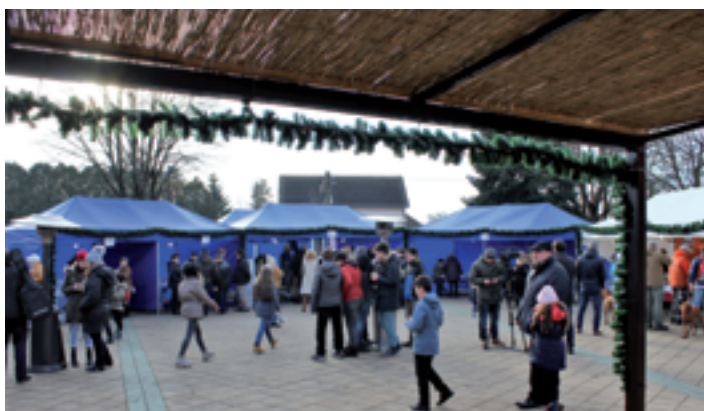
Adventi vásár a Hősök terén