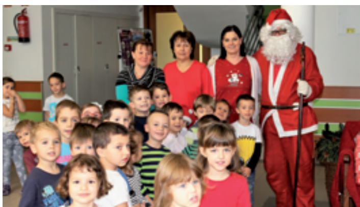
Mikulás az oviban