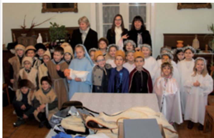
Óvodás betlehemezők a templomunkban