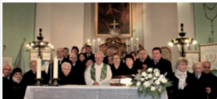
Házassági évfordulások szentmiséje a templomban