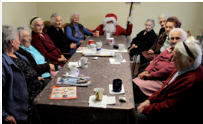
Mikulás az idősök napközijében