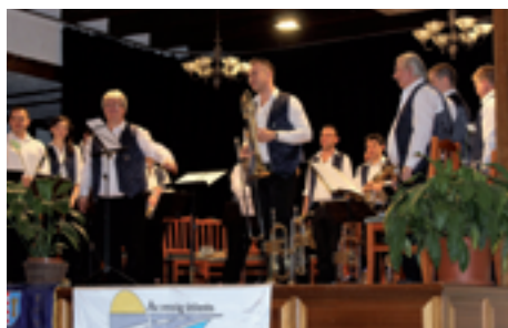
Az Újhartyáni Fúvószekar bemutató koncertje