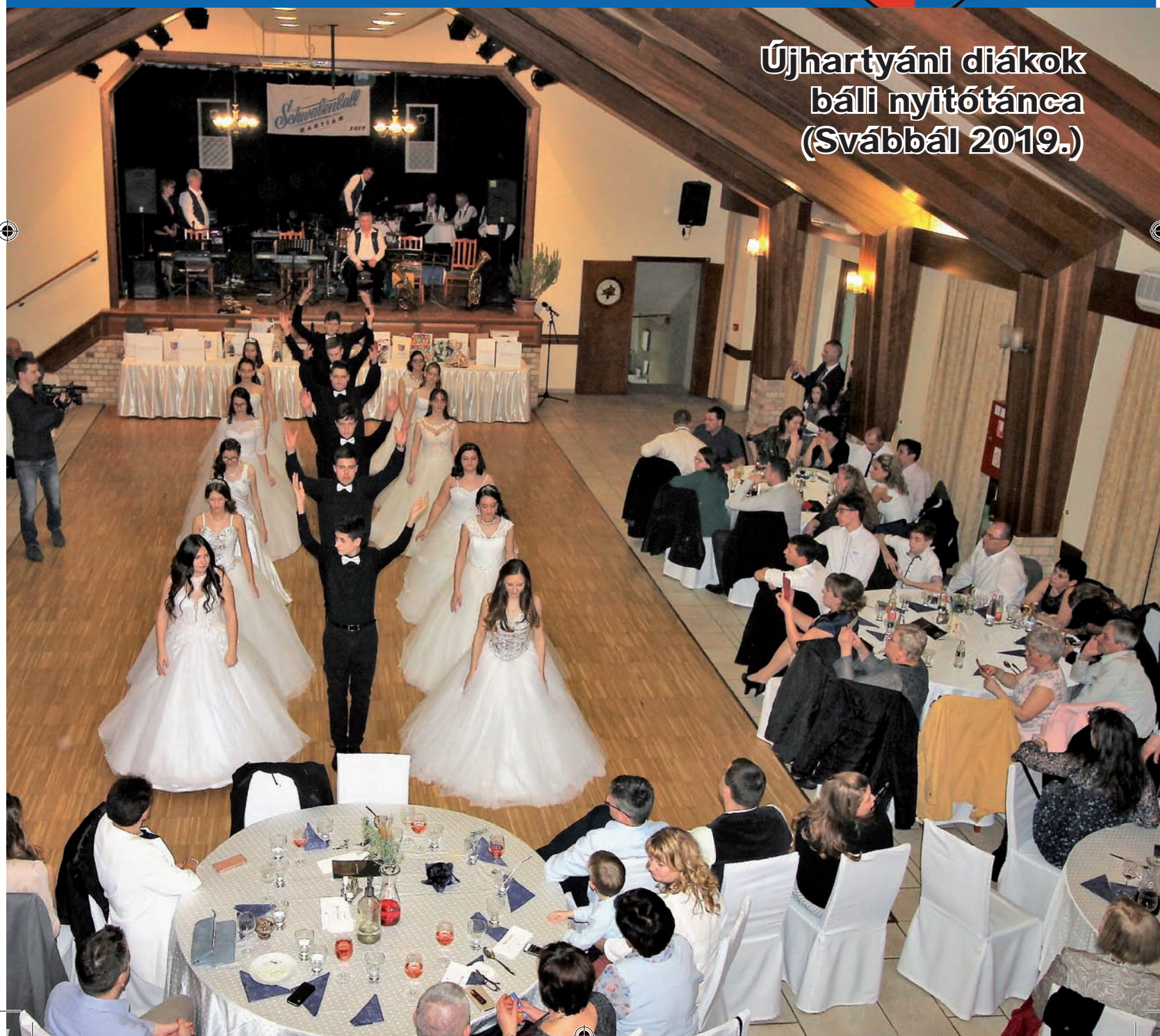
Újhartyáni diákok báli nyitótánca (Svábbál 2019.)